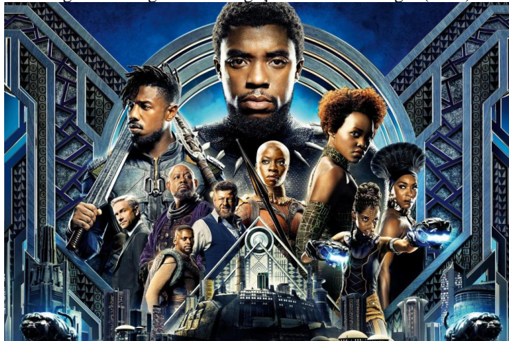
Figura 8: Imagem de divulgação de Pantera Negra (2018)