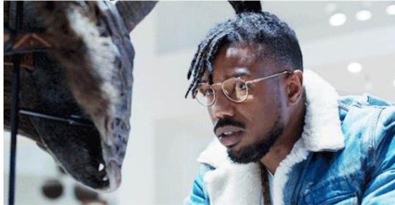
Figura 10: Erik Killmonger visualizando artefatos africanos no Museu Britânico

tecnologia de Wakanda para emancipar povos oprimidos globalmente, personifica o argumento enraizado nas teorias pós-coloniais que buscam contestar as estruturas de poder tradicionais. O personagem representa uma narrativa complexa que ilustra a interseção entre as Relações Internacionais contemporâneas e os legados do colonialismo, proporcionando uma reflexão crítica sobre as questões globais por meio de uma perspectiva pós-colonial.