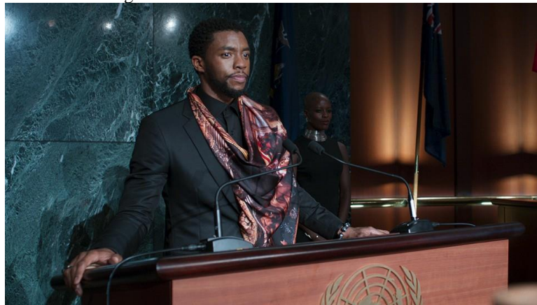
Figura 9: Rei T'Challa discursando na ONU

– Com todo o respeito, Rei T'Challa, o que uma nação de fazendeiros tem a oferecer ao resto do mundo?” (PANTERA NEGRA, 2018)