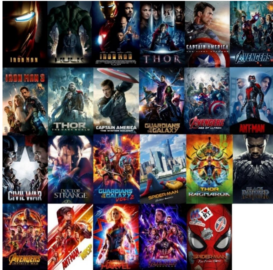
Figura 1: Pôsteres dos filmes da Saga do Infinito do UCM

da história (Omelete, 2023). O êxito que os filmes obtiveram não só estabeleceu a Marvel Studios como uma potência de Hollywood, mas também evidenciou o apelo universal das narrativas de super-heróis.