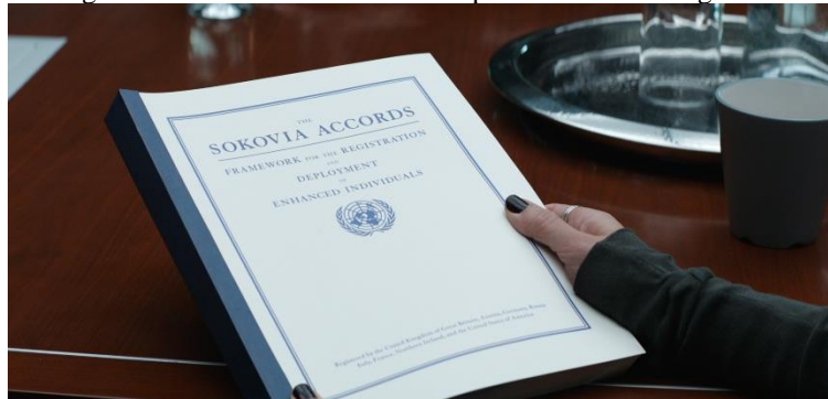
Figura 7: O Tratado de Sokovia é apresentado aos Vingadores