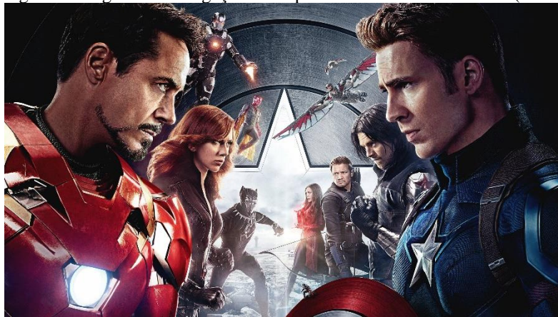
Figura 6: Imagem de divulgação de Capitão América: Guerra Civil (2016)