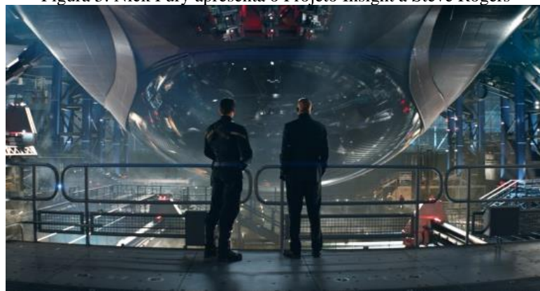
Figura 5: Nick Fury apresenta o Projeto Insight a Steve Rogers