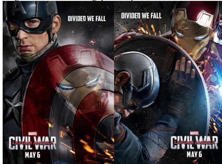
Figura 2: Pôsteres de divulgação de Capitão América: Guerra Civil

expressas no movimento #TeamCap VS #TeamIronMan , que tomou conta da internet em 2016, ano de lançamento do filme, e no slogan “United we stand, divided we fall” expressão utilizada em diversos momentos da História norte-americana e também usada em trailers e pôsteres de divulgação do filme.