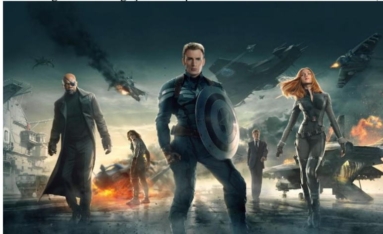
Figura 3: Imagem de divulgação de Capitão América: O Soldado Invernal (2014)