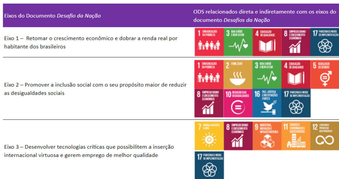
Figura 2 - ODS e Desenvolvimento

Desenvolvidos com clareza e objetividade, os ODS tornam claro a preocupação com o meio ambiente, desenvolvimento econômico e social, uma vez que todos os 17 ODS's são correlacionados e concebem a ideia de que nenhum direito humano pode ser integralmente implementado sem que os outros direitos também o sejam (SILVA, 2015). Diante disso, compreende-se que os avanços a serem obtidos por intermédio dos ODS não devem ser realizados isoladamente objetivo por objetivo, e sim de forma integrada e complementar para alcançar o desenvolvimento sustentável na sua plenitude.