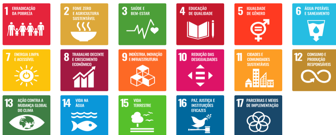
Figura 1 - Objetivos de Desenvolvimento Sustentável – Agenda 2030