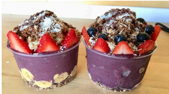
Imagem 1 - Açaí Bowl

Além disso, segundo Corr (2025), a influência das redes sociais e a disseminação de tendências alimentares contribuíram para a popularização do açaí em países como a Irlanda, onde o consumo dos "Açaí Bowls", como apresentado na imagem 1, se tornou uma tendência.